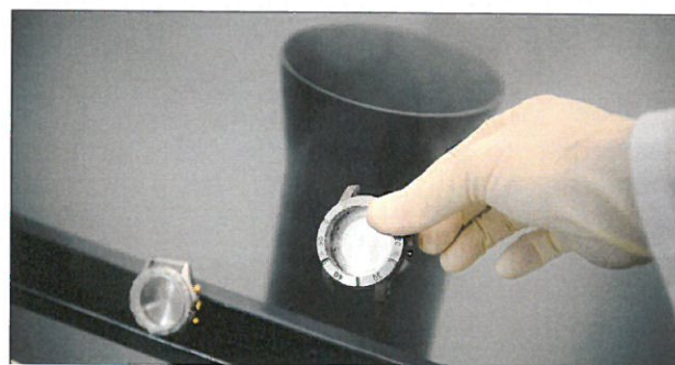
Usure par abrasion selon ISO 23160.