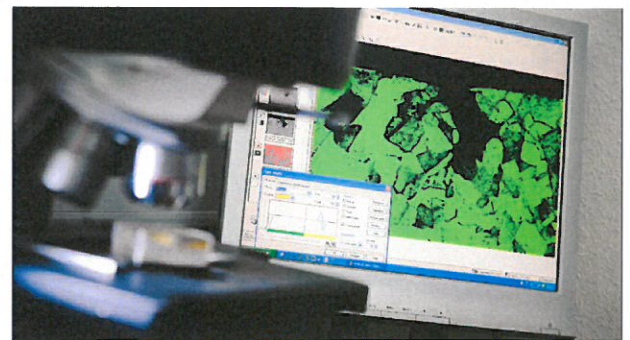
Rupture par fatigue d'une tige filetée en acier.

Les analyses métallographiques sont indispensables aussi bien pour des travaux de routine que dans le cadre d'investigations plus complètes ou d'expertises.